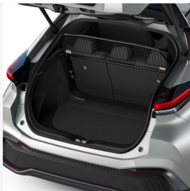
Koeravõrk Hind alates 505€ Kuumakse alates 7€/kuu