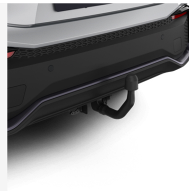
Eemaldatav veokonks – vertikaalne Hind alates 1369€ Kuumakse alates 20€/kuu

Hind sisaldab käibemaksu ja paigaldust, välja arvatud valuvelgedel talverattad, mis ei sisalda paigaldust. Hind võib varieeruda sõltuvalt edasimüüjast. Lisavarustuse saadavuse ja hindade täpsustamiseks pöördu lähima Toyota edasimüüja poole. Lisavarustuse kuumakse kehtib lisavarustuse ostmisel koos uue autoga