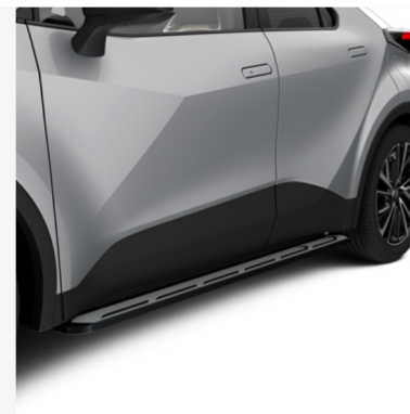
Külgmine astmelaud Hind alates 1202€ Kuumakse alates 18€/kuu