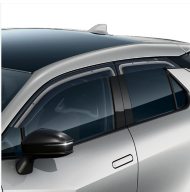
Tuulesuunajad (eesmised ja tagumised) Hind alates 212€ Kuumakse alates 3€/kuu