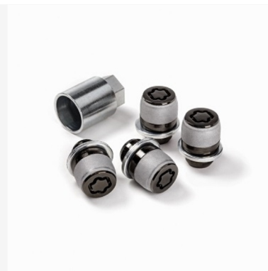
Velje lukustusmutter Hind alates 80€ Kuumakse alates 1€/kuu