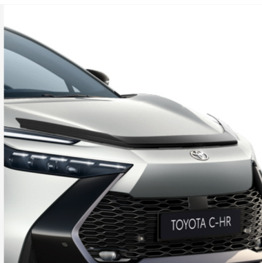
Kapoti tuulesuunaja Hind alates 214€ Kuumakse alates 3€/kuu