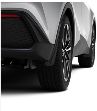
Porikaitsmed – eesmised + tagumised Hind alates 142€ Kuumakse alates 2€/kuu