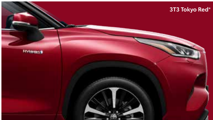
3T3 Tokyo Red 4