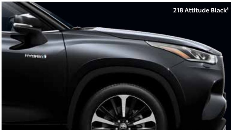
218 Attitude Black 5