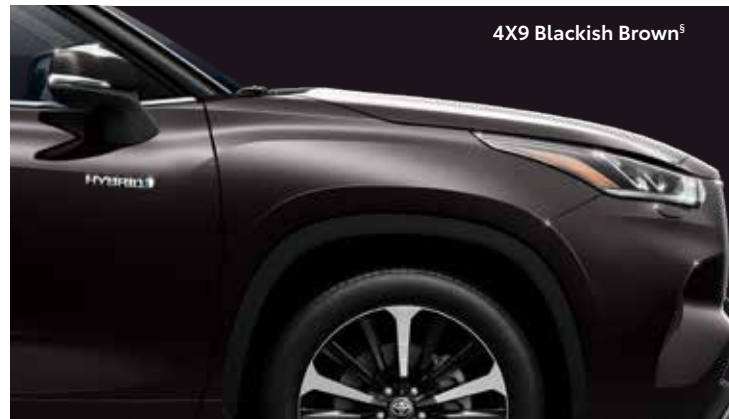
4X9 Blackish Brown 5