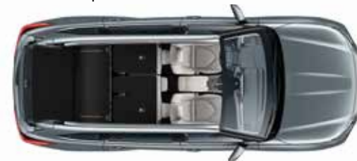
2 места 1909* литров