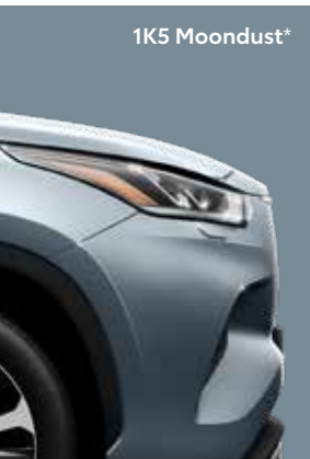
1K5 Moondust 4