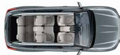
7 мест 332* литра

Чтобы вы ни захотели, куда бы вы ни отправлялись, Highlander предлагает самые разные конфигурации сидений.