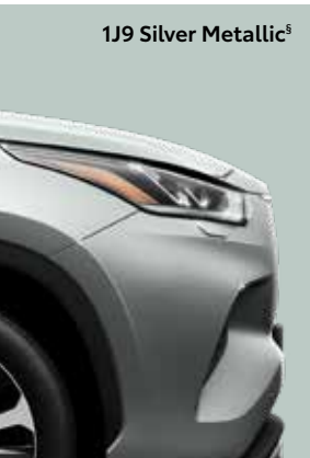
1J9 Silver Metallic 5