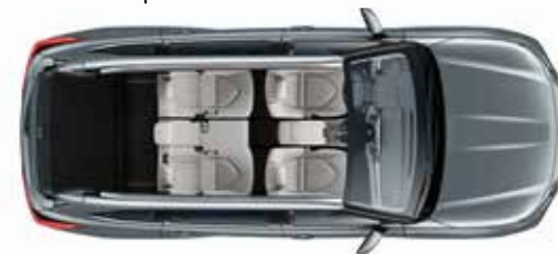
5 мест 865* литров