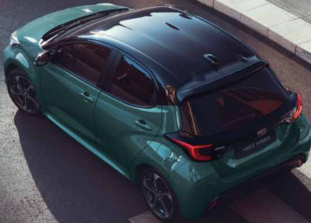
Yarise kahetoonilised värvivalikud

Vali pilkupüüdvate värvide erakordselt laiaast valikust, sealhulgas julgete põhivärvide ja sädelevate metallikvärvide seast. Kahe uue värvi Juniper Blue ja kahetoonilise Neptune Blue abil paistab su Yaris kindlasti silma.