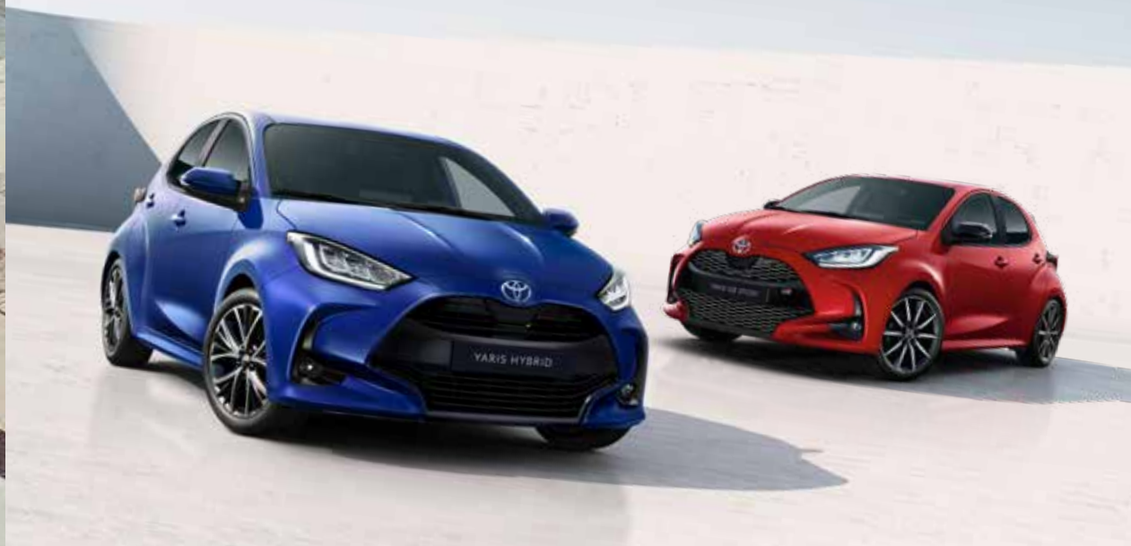
Yarise ühetoonilised värvivalikud